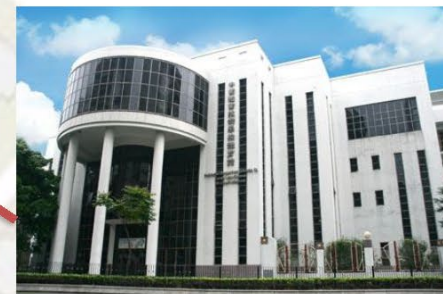
中葡職業技術學校體育館入口